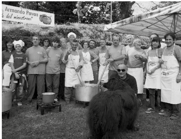
Alcuni membri della Pro Loco durante l'edizione 2007 del "Mangia Manta"

Nel mese di luglio piazza del Popolo ha ospitato due concerti. Il primo, giovedì 10, con "I due di notte", organizzato in collaborazione con la Pamoja, per la raccolta di fondi da destinare al doposcuola di Dubovy Log. Il secondo, venerdì 18, con i Khorakanè, su musiche di De André. Quest'ultimo incontro musicale si è dovuto interrompere per un imprevisto temporale abbattutosi sui presenti e non è stato più