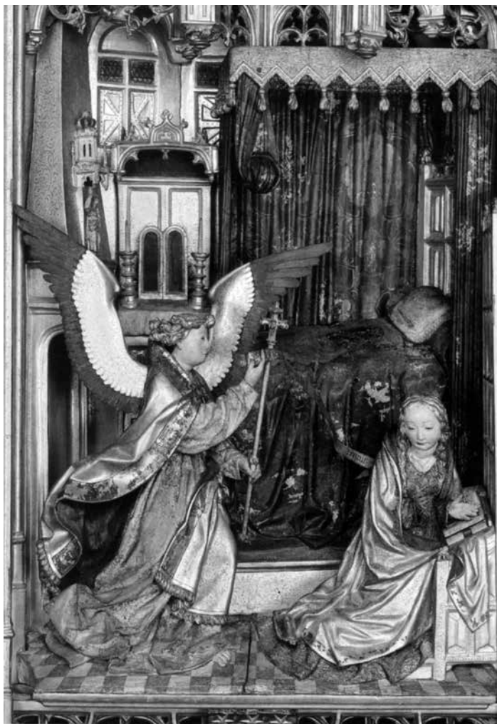
Retable de Saluces, particolare delle Storie di Maria

Singolare poi l'origine del nome Angela: nella storia di Maria ha un posto importante l'Arcangelo che annuncia la futura natività. Ma gli angeli, messaggeri di Dio, sono nella morfologia greca vocaboli di genere promiscuo, nella teologia esseri dall'identità problematica (di qui le famose dispute bizantine sul "sesso degli angeli"). Ebbene in Italia è di gran lunga più diffusa la forma femminilizzata. Tuttavia la sequenza biblica, se non mariana, dei nomi è a livello nazionale spezzata dall'inserzione di un nome pagano, anzi poetico, Rosa con 108.193 occorrenze (vien da pensare ai versi maliziosi di Aldo Palazzeschi, quando si chiede perché gli uomini paragonino così spesso le donne a un fiore e mai un fiore a una donna). A