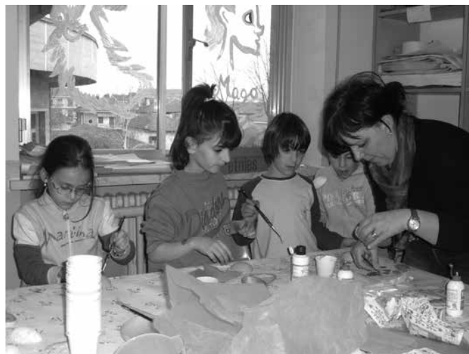
Il murales in corso di realizzazione

Quando ho proposto questo lavoro, non pensavo che sarebbe stato accolto con tale interesse dai ragazzi. Il mio scopo era quello di dare ad ognuno di loro un'opportunità di introspezione per prendere coscienza delle proprie emozioni e della capacità di poterle esternare.